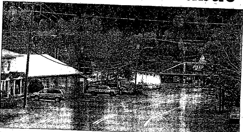
Selon la réforme proposée, la municipalité de Petit-Saguenay serait expédiée dans la circonscription de René-Lévesque, sur la Côte-Nord.

Même son de cloche du côté du député de Chicoutimi, Stéphane Bédard. «Cette proposition ne correspond pas aux réalités du terrain. Chicoutimi et Chicoutimi-Nord forment la même entité, il n'aurait aucun sens de les séparer. Leurs besoins sont similaires. Nous ferons les représentations nécessaires au moment opportun afin que cette erreur ne soit pas commise», a-t-il dit.